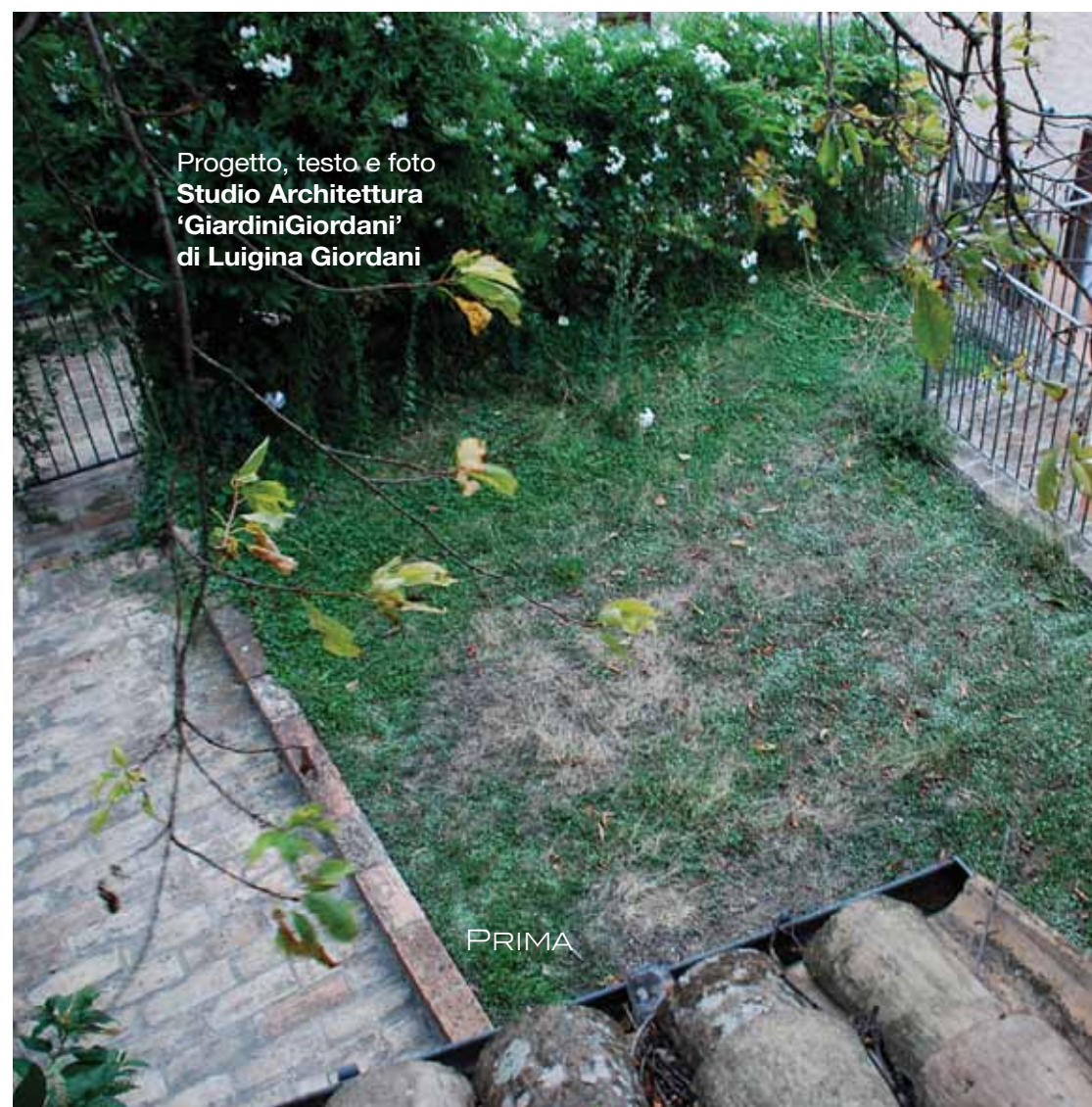
Progetto, testo e foto Studio Architettura 'GiardiniGiordani' di Luigina Giordani

P asseggiando per i centri storici e alzando il naso all'insù possiamo scoprire dei piccoli polmoni verdi che, come dei gioielli, ornano borghi e città. A volte, semplici vasi o piccole fioriere o in altri casi, veri e propri giardini in quota, i preziosi giardini pensili. Preziosi perché oltre al loro impatto estetico racchiudono un valore ambientale ed economico non indifferente. Questi sistemi contribuiscono al miglioramento energetico degli edifici, all'aumento del loro valore economico, garantiscono un drenaggio continuo e controllato delle acque meteoriche con un conseguente risparmio idrico. Inoltre, il verde pensile offre la possibilità di mitigare gli impatti antropici