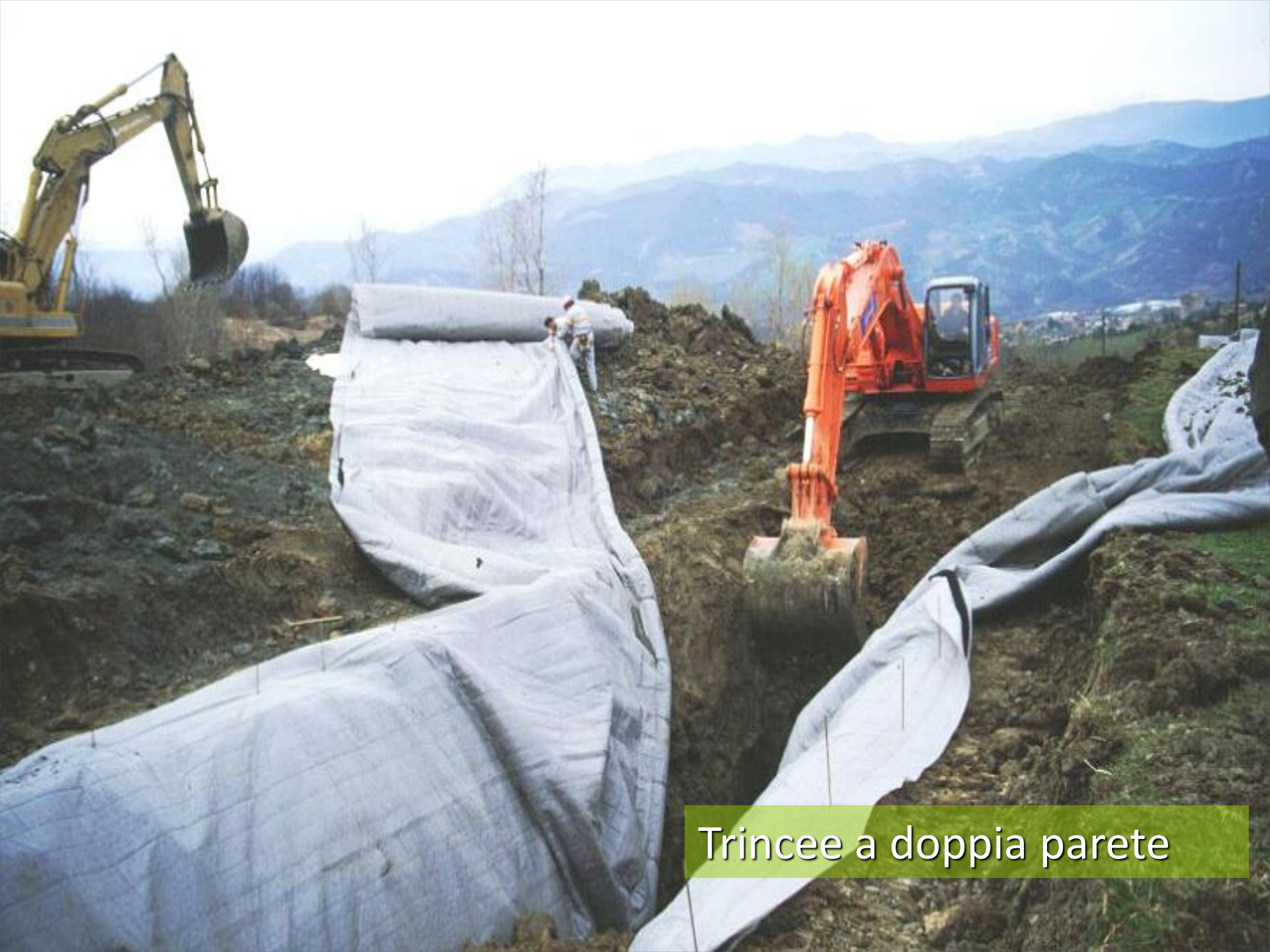
Trincee a doppia parete